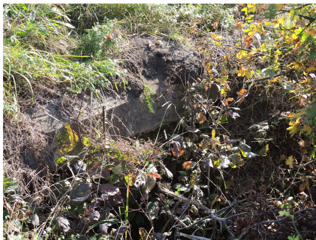
Pohľad na výtok