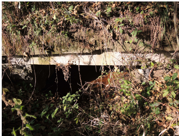
Pohľad na výtok