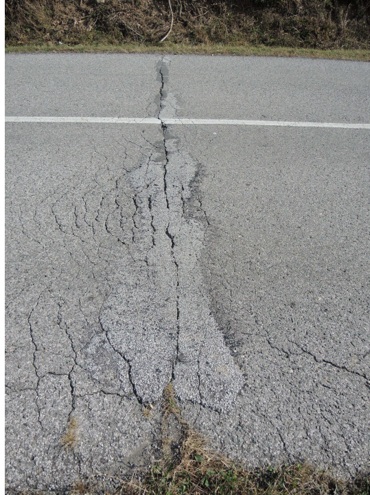
Pohľad na cestu nad priepustom

Samotný priepust je čistý, vtokové čelo a rímasy zachovalé, výtokové čelo zachovalé, rímasy mierne poškodená. Priekopy nespevnené, nečistené.