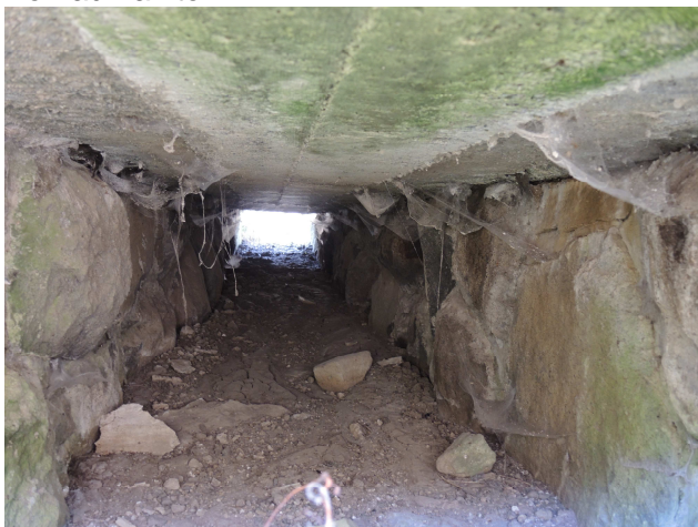
Pohľad do priepustu

Samotný priepust je zanesený, rímsy poškodené, čelá zanesené. Priekopy nespevnené, nečistené.