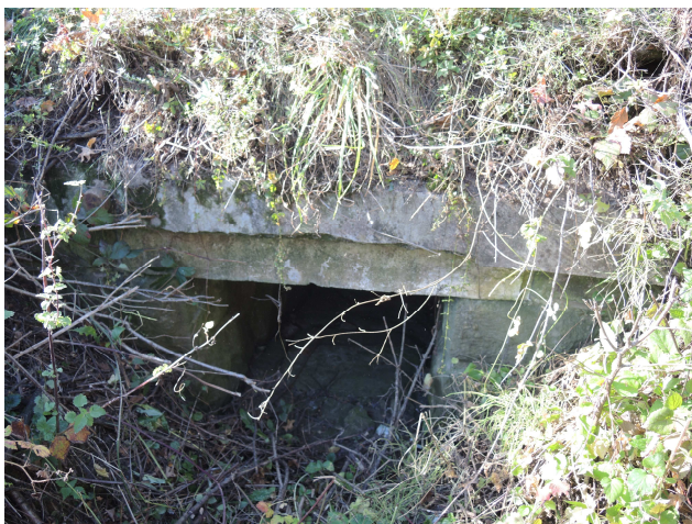
Pohľad na vtok