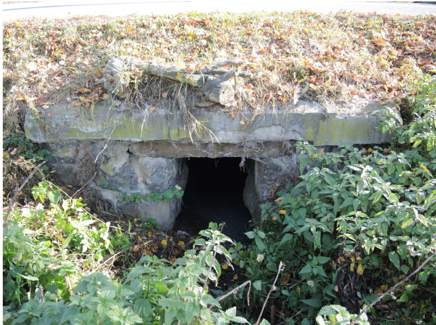
Pohľad na výtok