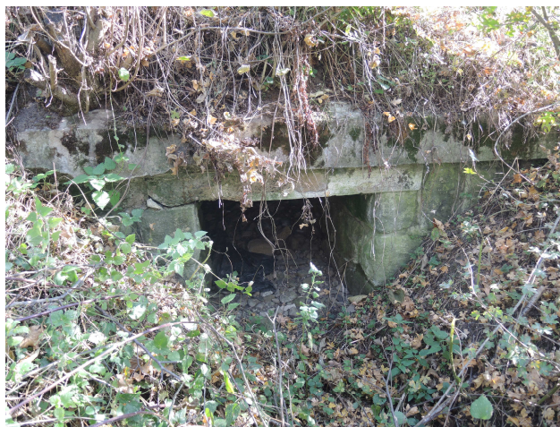
Pohľad na výtok