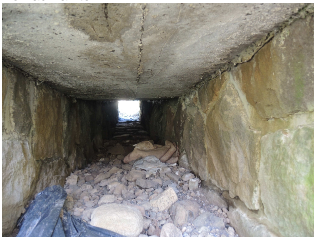
Pohľad do priepustu

Samotný priepust je mierne zanesený, vtokové čelo s rímsou v celku zachovalé, výtokové čelo s rímsou taktiež. Priekopy spevnené, nečistené. Doska nad priepustom v časti prelomená.