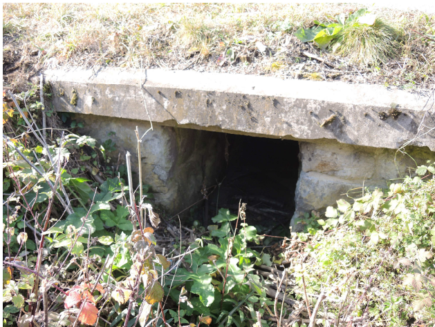
Pohľad na vtok