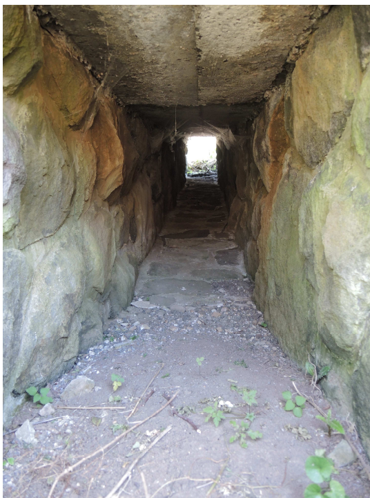
Pohľad do priepustu