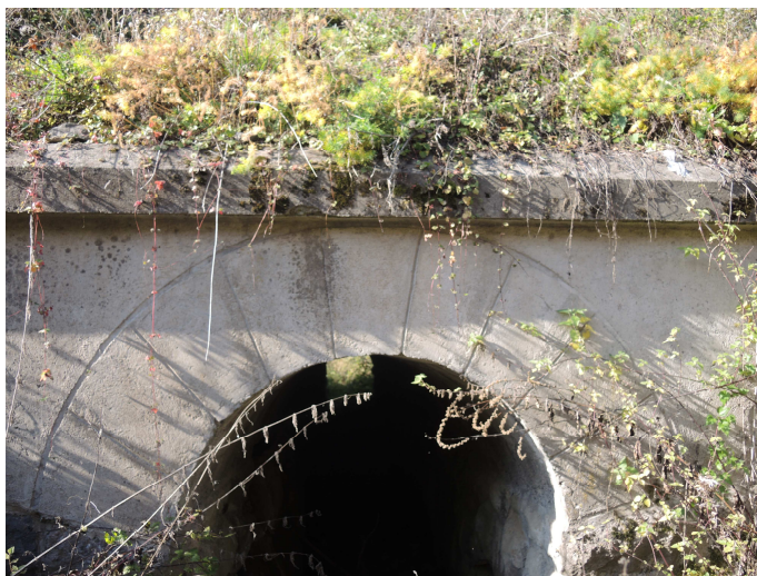
Pohľad na vtok