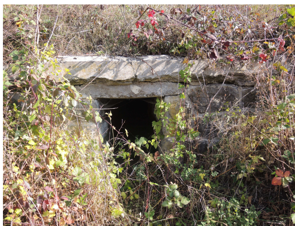
Pohľad na výtok