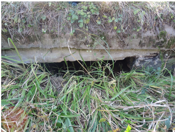
Pohľad na vtok