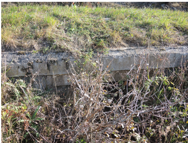
Pohľad na vtok