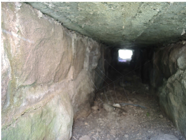
Pohľad do priepustu

Samotný priepust je mierne zanesený, vtokové a výtokové čelo mierne poškodené , rímasy poškodené. Priekopy nespevnené, nečistené.