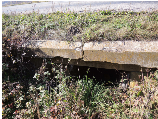
Pohľad na výtok