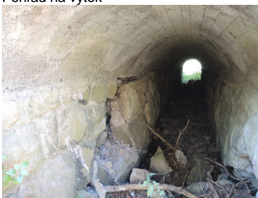
Pohľad na výtok

Samotný priepust je zanesený, vtokové čelo a rímsa zachovalé, výtokové čelo mierne poškodené, rímsa poškodená. Vnútro priepustu miestami poškodené. Priekopy nespevnené, nečistené.