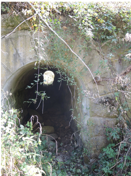
Pohľad na výtok