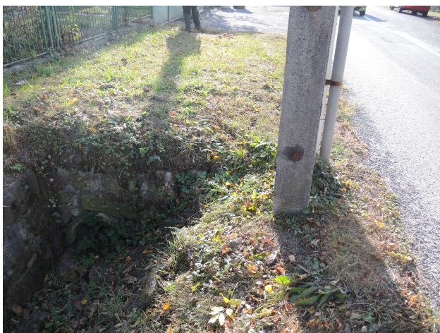
Pohľad na vtok