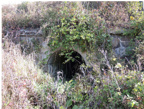
Pohľad na výtok