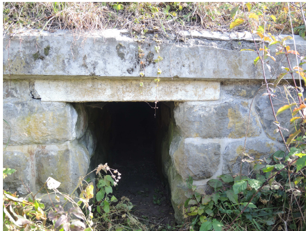
Pohľad na výtok