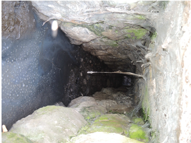
Pohľad do priepustu

Samotný priepust je mierne zanesený, vtokové a výtokové čelo mierne poškodené, rímsa narušená. Priekopy nespevnené, nečistené.