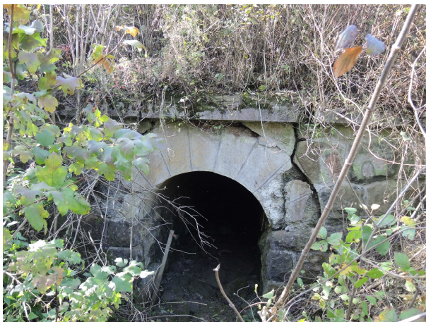
Pohľad na vtok