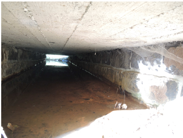
Pohľad do priepustu