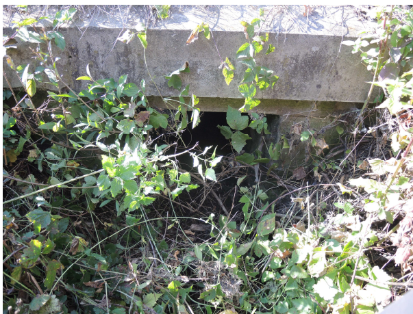
Pohľad na vtok