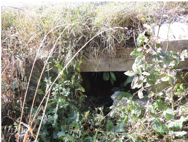
Pohľad na vtok