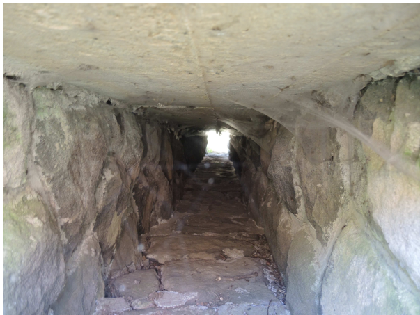
Pohľad do priepustu

Samotný priepust je čistý, vtokové čelo a rímasy zachovalé, výtokové čelo zachovalé, rímasy poškodená. Priekopy nespevnené, nečistené.